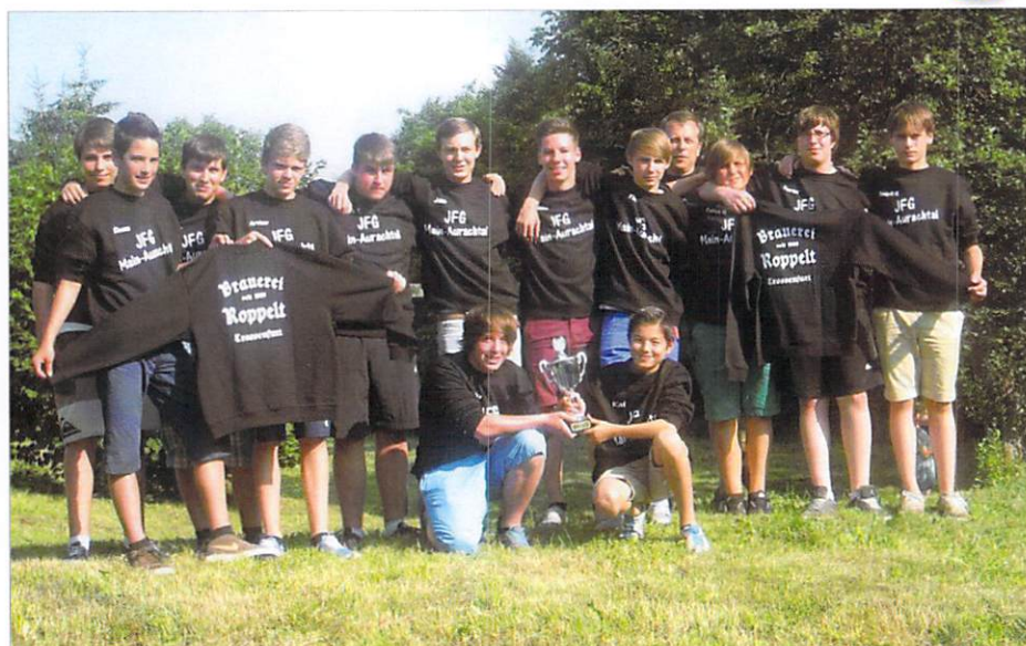
Pokalsieg in Hallstadt 2014