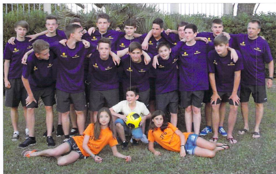
Abschlussfahrt nach Riccione 2014